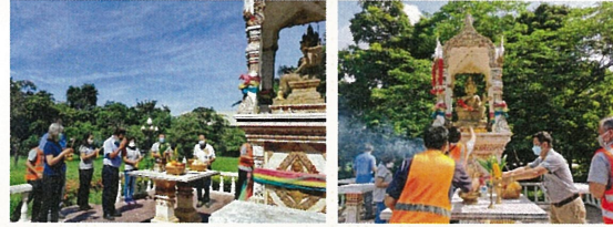
พิธีสักการะบูชาสิ่งศักดิ์สิทธิ์ประจำโรงงานเพื่อเป็นสิริมงคล เนื่องในวันครบรอบ 32 ปี บริษัท ปูนซีเมนต์เอเชีย จำกัด (มหาชน) ในวันที่ 23 สิงหาคม 2564