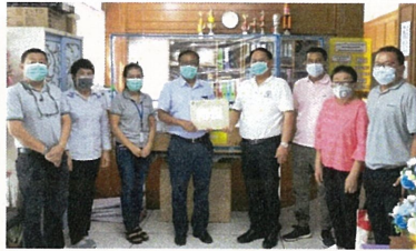
สนับสนุนงบประมาณในการจัดซื้ออุปกรณ์ที่จำเป็น ให้กับโรงพยาบาลส่งเสริมสุขภาพตำบลหนองคันทรี ต.พุกวาง