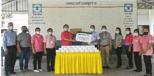
สนับสนุนชุดตรวจโควิดแบบเร่งด่วน (Antigen Test Kit) ให้กับเทศบาลตำบลพยุห์ จำนวน 500 ชุด เพื่อใช้ในโครงการเฝ้าระวัง ป้องกัน และควบคุมการแพร่กระจาย ของไวรัสโควิด-19 ให้กับชาวชุมชนตำบลพยุห์