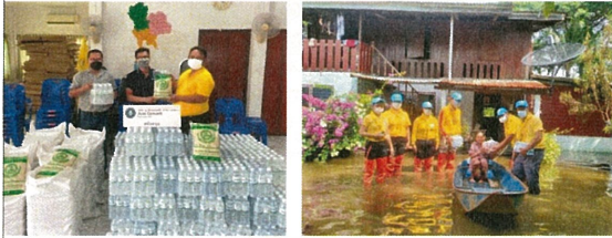
มอบข้าวสารและน้ำดื่มเพื่อช่วยเหลือผู้ประสบอุทกภัย ในเขตตำบลบ้านยาง และ ตำบลคอนหุด จ.สระบุรี