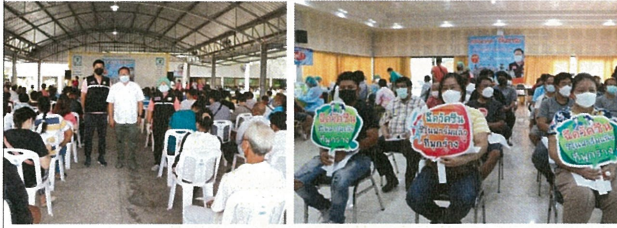
ร่วมสนับสนุนโครงการฉีดวัคซีนป้องกันไวรัสโควิด 19 เทศบาลตำบลพุกวาง