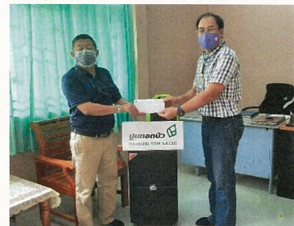
สนับสนุนอุปกรณ์และงบประมาณโครงการเฝ้าระวังสุขภาพ ผู้ป่วยโรคเรื้อรัง รพ.สต.หนองคนที ตำบลพยุห์