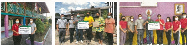
คณะกรรมการชุมชนสัมพันธ์ ได้นำทุนการศึกษาประจำปี 2564 ไปมอบให้กับนักเรียนตามโรงเรียนต่างๆ ในเขตตำบลพุกวางและตำบลเขาวง ผ่านผู้อำนวยการโรงเรียนและผู้นำชุมชน เพื่อส่งเสริมด้านการศึกษา ให้กับนักเรียนในชุมชนรอบรั้วโรงงานได้พัฒนาเป็นเยาวชนที่มีศักยภาพในอนาคตต่อไป