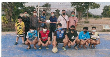
สนับสนุนงบประมาณซ่อมแซมสนามฟุตบอล ภายในชุมชน เพื่อให้เยาวชนหมู่ 5 และหมู่ 9 ได้มีพื้นที่ในการเล่นกีฬา ส่งเสริมสุขภาพ ความรักความสามัคคีในชุมชน