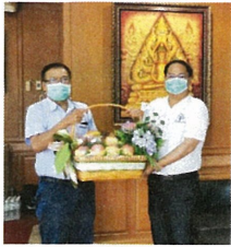
ร่วมแสดงความยินดี นายกเทศมนตรีตำบลทุกช่วงคนใหม่