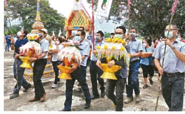
ร่วมเป็นเจ้าภาพทอดกฐินสามัคคีประจำปี 2564 ณ วัดหนองสองตอน ตำบลพุกวาง