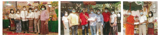
ร่วมงานกฐินสามัคคีประจำปี 2564 ตามวัดต่างๆ ในเขตตำบลพุกวางและตำบลใกล้เคียง