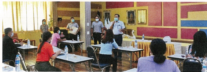
สนับสนุนงบประมาณให้กับโครงการต่างๆ ของโรงเรียนในเขตอำเภอพระพุทธบาท รวม 11 โรงเรียน เพื่อพัฒนาคุณภาพด้านการศึกษาให้กับนักเรียนในชุมชนต่อไป