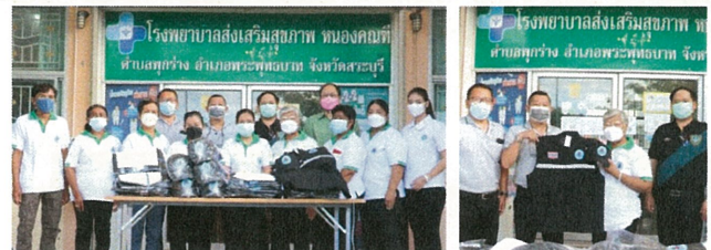
สนับสนุนกิจกรรม และมอบเสื้อพร้อมหมวกให้กับ อสม.ตำบลพุกวาง สำหรับเป็นชุดปฏิบัติงานดูแลด้านสุขภาพและสาธารณสุขภายในชุมชน จำนวน 101 ชุด