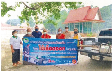
สนับสนุนโครงการรณรงค์ป้องกันโรคไข้เลือดออกในตำบลพยุห์ บริการฉีดพ่นหมอกควัน เพื่อกำจัดยุงลาย และมอบอุปกรณ์กำจัดลูกน้ำยุงลายให้กับชุมชนต่างๆ ภายในเขตตำบลพยุห์