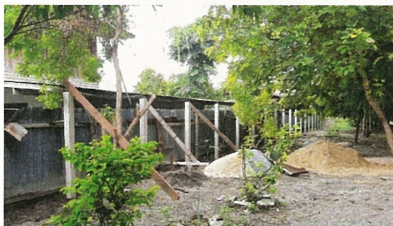
สนับสนุนปูนซีเมนต์ดอกบัวเขียวจำนวน 5 ตัน เพื่อก่อสร้างกำแพงวัด และสนับสนุนงบประมาณโครงการปรับปรุงประตูทางเข้าวัดหนองคนที ตำบลพยุห์