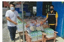
สนับสนุนการจัดตั้งศูนย์พักคอยสำหรับผู้ป่วยโควิด 19 ประจำอำเภอ พระพุทธบาท และสนับสนุนเครื่องอุปโภคบริโภคที่จำเป็นสำหรับผู้ที่พักตัว ในเขตตำบลพุกวาง โดยมอบผ่านผู้นำชุมชน