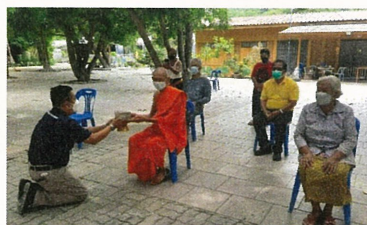
สนับสนุนการก่อสร้างเมรุหลังใหม่ ของวัดพุกวาง ทดแทนของเดิมที่ชำรุด จากการใช้งานมานานกว่า 20 ปี