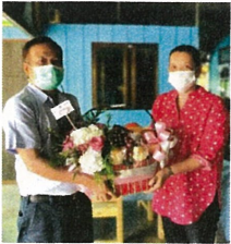
ร่วมแสดงความยินดี กำนันตำบลทุกช่วงคนใหม่