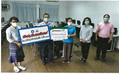
สนับสนุนการปรับปรุงห้องเรียนคอมพิวเตอร์ รวมถึงวัสดุ อุปกรณ์การเรียน โต๊ะ เก้าอี้ ให้กับโรงเรียนวัดหนองคนที (พลาบุฏ)