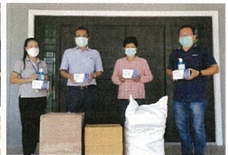
มอบหน้ากากอนามัย เจลแอลกอฮอล์ และข้าวสาร 5 กก. ให้กับชาวบ้านรอบรั้วโรงงาน จำนวน 2,200 ครอบครัว ในช่วงที่ไวรัสโควิด 19 ยังคงระบาดอย่างต่อเนื่อง