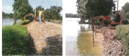
สนับสนุนการปรับปรุงแนวตลิ่งสะพานโยธาสาย 2 ที่ชำรุด เพื่อความปลอดภัยแก่ชาวบ้านที่สัญจรผ่านไปมา